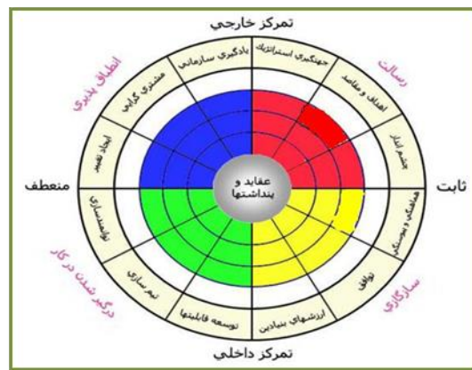
شکل ۲ - مدل مفهومی فرهنگ سازمانی دنیسون

اگر بر اساس اطلاعات فوق، نمای فرهنگ سازمانی فعالان فرهنگی ترسیم شود، شکل ۲ به دست خواهد آمد؛ بر اساس این تصویر، ابعاد و شاخص‌های فرهنگ سازمانی فعالان فرهنگی در حد متوسط و بالاتر از متوسط قرار گرفته است؛ در طیف منعطف - ثابت و در میزان تمرکز داخلی و تمرکز به خارج نیز اختلاف قابل توجهی مشاهده نمی‌شود.